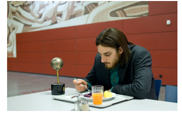
Die Einsamkeit der Primzahlen