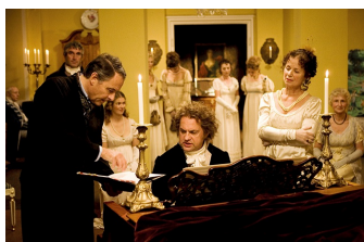
Giganten - Ludwig von Beethoven