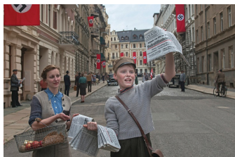
Jeder stirbt für sich allein