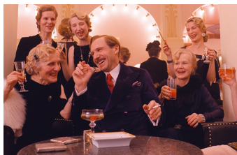
Grand Budapest Hotel