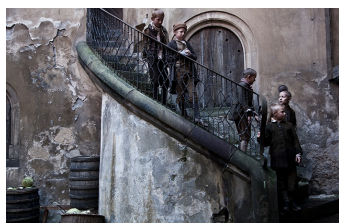
Die Vermessung der Welt