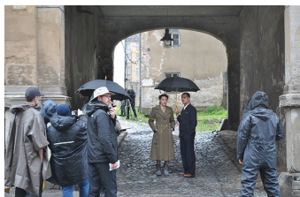
Auf Wiedersehen Deutschland