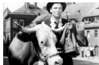
Der Ochse von Kulm

Liste von Dreharbeiten in der Stadt Görlitz www.goerlitz.de/Goerliwood-Filmografie.html