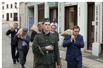
Zweiter Weltkrieg - Das erste Opfer