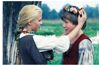
Die Geschichte von der Gänseprinzessin und ihrem treuen Pferd Falada