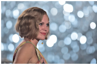
Nacht über Berlin