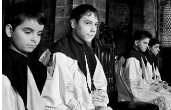
Engel im Fegefeuer