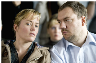
Über den Tod hinaus