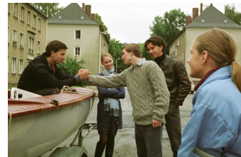
Go West - Freiheit um jeden Preis