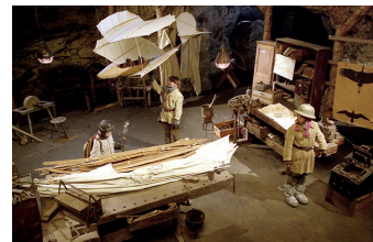
Stella und der Stern des Orients

Filmdatenbank der MDM www.mdm-online.de > Drehreport