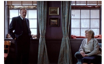
Vor der Morgenröte