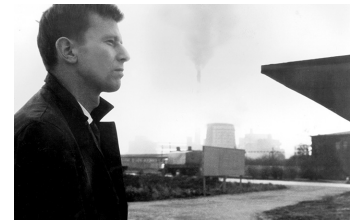
Der geteilte Himmel

Filmdatenbank der MDM unter www.mdm-online.de > Film Commission > Drehreport