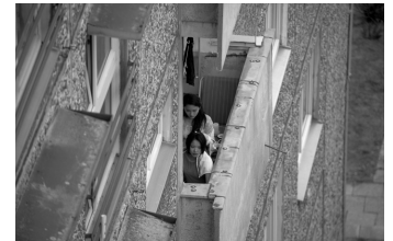
Wir sind jung. Wir sind stark.