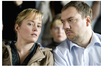
Über den Tod hinaus