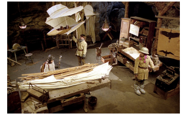
Stella und der Stern des Orients

Filmdatenbank der MDM www.mdm-online.de > Drehreport