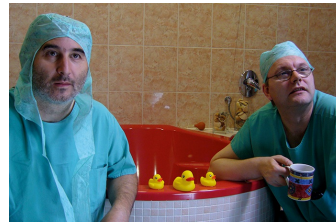
Der lange Weg ans Licht