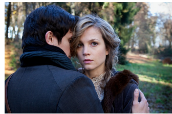
Das Mädchen und der Tod