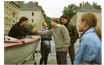
Go West - Freiheit um jeden Preis