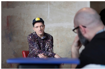
Der letzte Remix