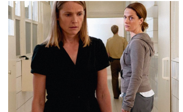
Das letzte Schweigen