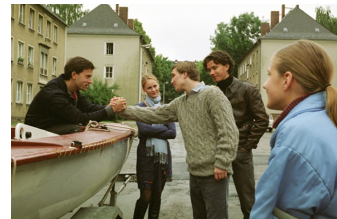
Go West - Freiheit um jeden Preis