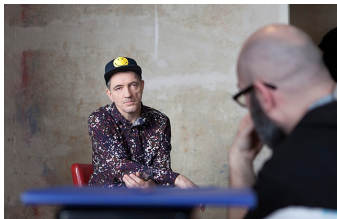
Der letzte Remix