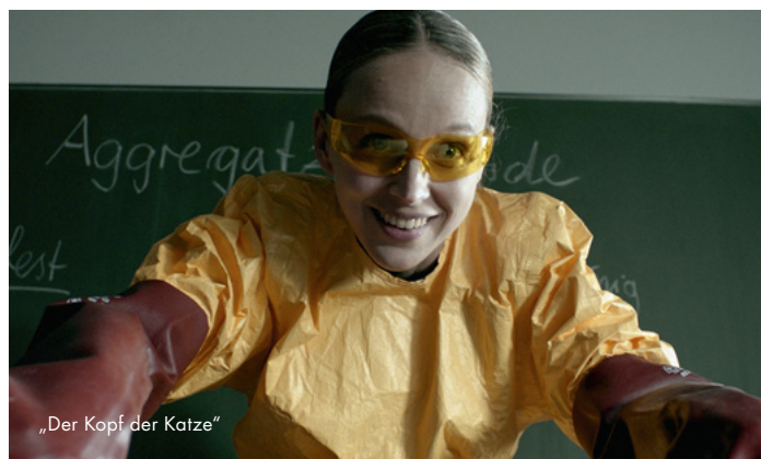
„Der Kopf der Katze“

Dokumentarfilm Antragsteller: Kloos & Co. Ost UG; Buch/Regie: Antje Schneider Fördersumme: 120.000,00 €