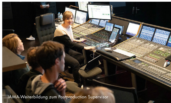
IAMA-Weiterbildung zum Postproduction Supervisor

Antragsteller: Werkleitz Gesellschaft e.V. Fördersumme: 15.000,00 €