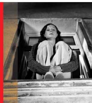
Beas Vorstellung von Glück

Produzentin: Simone Baumann Autor: Albert Knechtel Regie: Albert Knechtel Inhalt: Eine Kulturgeschichte der Farbe Blond: Von Aphrodite bis Barbie, von Messalina bis Madonna – von alters her suggeriert diese Haarfarbe Status und Schönheit, bedient Archetypen im Bewusstsein der Menschen. Der Film erzählt die Geschichte eines globalen Mythos, einer ewigen Faszination. Fördersumme: 40.000,00 EUR