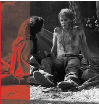
Kreuzzug in Jeans