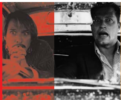
No Snow – Vier Männer im Regen