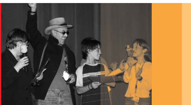
Internationales Kinderfilmfestival »Schlingel« 2005