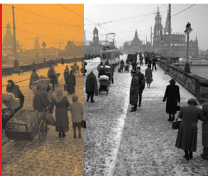
Dresden – Der Brand