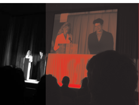
Filmfest Dresden 2005

Herausgeber: Mitteldeutsche Medienförderung GmbH Redaktion: Ivonne Köhler, Oliver Rittweger Druck: Jütte-Messedruck Leipzig GmbH