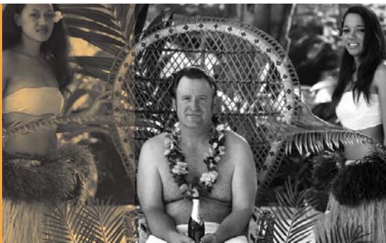
Schröders wunderbare Welt