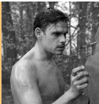
Dieses Jahr in Czernowitz