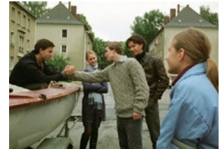
Go West – Freiheit um jeden Preis