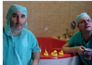
Der lange Weg ans Licht