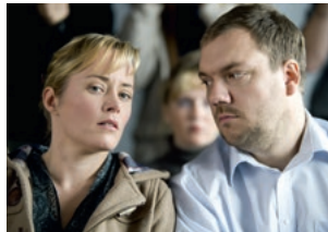
Über den Tod hinaus