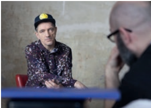
Der letzte Remix