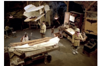
Stella und der Stern des Orients

Filmdatenbank der MDM unter www.mdm-online.de > Drehreport