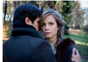
Das Mädchen und der Tod