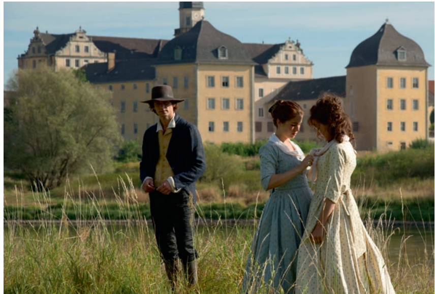
„Die geliebten Schwestern“