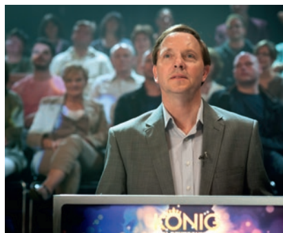
„König von Deutschland“