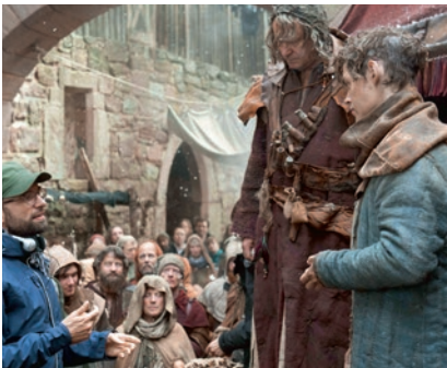
Philipp Stölzl, Stellan Skarsgård und Tom Payne am Set von „Der Medicus“

Auch 2013 folgten zahlreiche Filmteams dem Ruf der reizvollen Locations und modernen Studios in Sachsen, Sachsen-Anhalt und Thüringen. Die unkomplizierten Drehbedingungen und die effiziente Infrastruktur in den drei mitteldeutschen Bundesländern haben sich in Branchenkreisen ebenfalls längst herumgesprochen. Die Bandbreite der verwirklichten Projekte reichte einmal mehr vom ambitionierten Arthouse-Drama bis hin zur aufwändigen Roman-Adaption.