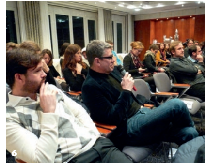
4 KURZSUECHTIG Preisverleihung 5 Deutsches Kinder-Medien-Festival GOLDENER SPATZ 6 ACE Finanzierungsworkshop in Halle (Saale)

strömten dort in die Kinos – der Großteil der Vorstellungen war ausverkauft. In den Wettbewerben wurden 2012 Preisgelder in Rekordhöhe von 79.000 Euro ausgeschüttet. Darüber hinaus war das älteste Dokumentarfilmfestival der Welt bei seiner 55. Ausgabe erneut Branchentreffpunkt für Filmemacher, Produzenten, Redakteure, Verleiher und Finanziers aller Nationalitäten. Zum zweiten Mal förderte die MDM das Leipziger Festival KURZSUECHTIG, das sich seit dem Start im Jahr 2004 zu einer immer wichtigeren Plattform für den Nachwuchs in der Region entwickelt hat. In den drei Sparten Animationsfilm, Dokumentarfilm und Fiktion flimmerten erneut zahlreiche Kurzfilme über die Leinwände der Schaubühne Lindenfels.