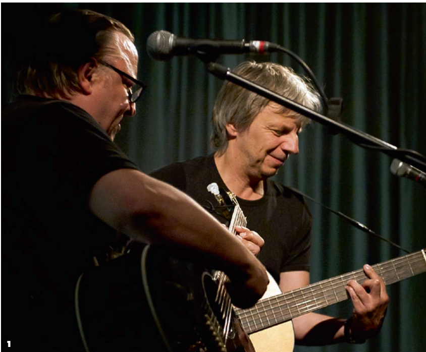
1 Axel Prahl und Andreas Dresen bei Trekoulor – Filmfest Weimar 2 Preisverleihung der Filmkunsttage Sachsen-Anhalt 3 Preisträger des DOK Leipzig 2012

Jubiläum beging das Kinder-Medien-Festival GOLDENER SPATZ: Kino-TV-Online. Es bot in Gera und Erfurt zum 20. Mal einen umfassenden Überblick über deutschsprachige und koproduzierte Kinderfilm- und -fernsehproduktionen sowie Onlineangebote für Kinder. Im Rahmen des Festivals, das sich erneut großer Resonanz erfreute, stellten am 10. Mai die zwölf Absolventen der Akademie für Kindermedien 2011/2012 ihre Vorhaben in den Bereichen Spielfilm, Animationsserie sowie Kinderbuch im STUDIOPARK Kinder-MedienZentrum in Erfurt der Öffentlichkeit vor. An das beste Projekt vergab die MDM ihren mit 12.500 Euro dotierten Förderpreis. Aktuelle Produktionen des Kinder- und Jugendfilmschaffens wurden zudem in Chemnitz beim 17. Internationalen Filmfestival für Kinder und junges Publikum SCHLINGEL präsentiert. Zu den unverrückbaren Eckpfeilern der mitteleuropäischen Festivallandschaft gehört auch DOK Leipzig, das Internationale Leipziger Festival für Dokumentar- und Animationsfilm. Rund 37.000 Besucher