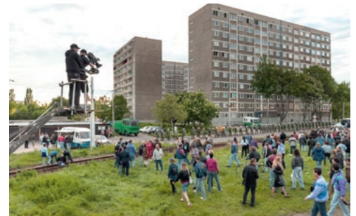
Dreharbeiten zu „Wir sind jung. Wir sind stark.“ in Halle-Neustadt

In einen anderen Studiokomplex, die Media City Atelier GmbH (MCA) in Leipzig, hielt für mehrere Tage der Franzose Olivier Assayas Einzug. Der Regisseur, der sein Golden Globe-prämiertes Mammutwerk „Carlos – Der Schakal“ 2009 überwiegend in Sachsen-Anhalt und Sachsen realisiert hatte, suchte für sein neues Drama „Sils Maria“ mit Stars wie Juliette Binoche und Kristen Stewart im September darüber hinaus auch diverse Gebäude in der Innenstadt wie den Leipziger Hauptbahnhof, die Oper und das Schauspielhaus auf.