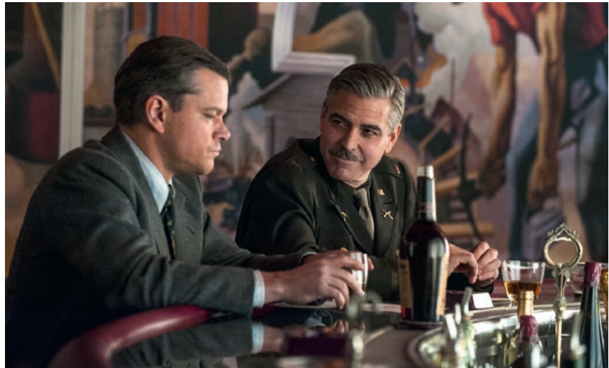
„Monuments Men – Ungewöhnliche Helden“

Um vielversprechenden Talenten ihre ersten professionellen Schritte in der Filmbranche zu ermöglichen, stellte die MDM fast 2,7 Millionen Euro für spannende Nachwuchsprojekte zur Verfügung. So förderte sie unter anderem Damien John Harpers Spielfilmdebüt „Los Angeles“, das