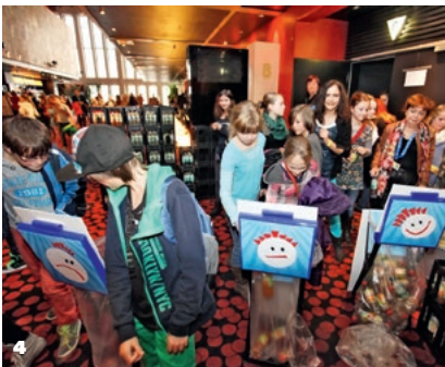
4 SCHLINGEL -Publikum beim Voting 5 6. Filmmusiktage Sachsen-Anhalt 6 Drehvorbereitungen beim Regieworkshop des TP2 Talentpool

Auch durch die Verankerung von Weiterbildungs- und Trainingsangeboten befördert die MDM die Entwicklung des Medienstandorts Mitteldeutschland. Ein wichtiges Qualifizierungsprogramm für den Nachwuchs in der Region ist der TP2 Talentpool, der ab April 2013 zum bereits 10. Mal jungen Talenten aus Sachsen, Sachsen-Anhalt und Thüringen die Möglichkeit bot, mit professioneller Unterstützung den Weg ins Filmgeschäft einzuschlagen. Alle Teilnehmer durchliefen innerhalb von zehn