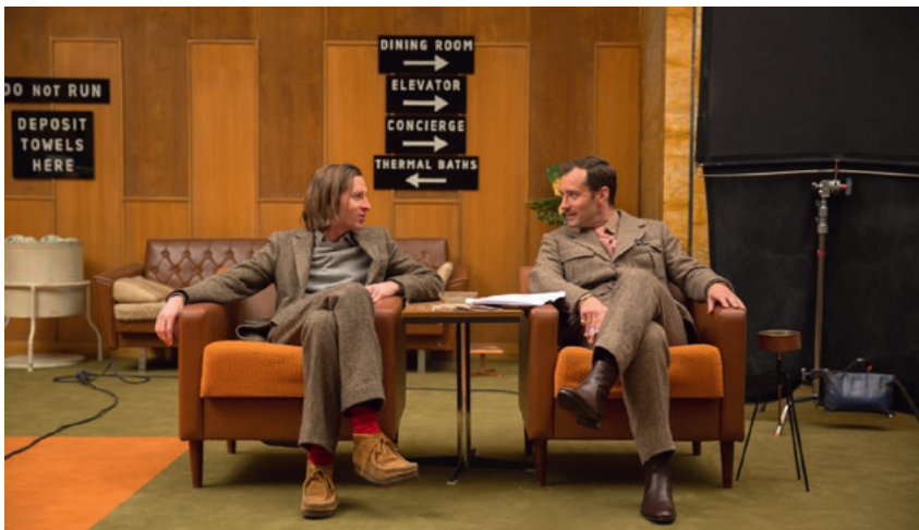
Wes Anderson und Jude Law am Set von „Grand Budapest Hotel“