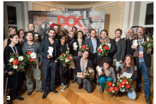
1 Preisverleihung Filmfest Dresden 2013 2 Kinderjury beim GOLDENEN SPATZ 2013 3 Preisträger des DOK Leipzig 2013

3. Auflage im Oktober 2013 bereits acht Städte beteiligt. Schwerpunkt der Vorführungen in Magdeburg, Genthin, Aschersleben, Dessau, Halle (Saale), Salzwedel, Burg und Stendal waren erneut Werke, die mit Fördergeldern der MDM in Mitteldeutschland gedreht wurden. Eine Werkchau rückte dabei besonders Filme in den Fokus, die seit 1998, dem Gründungsjahr der MDM, an Locations in Sachsen-Anhalt entstanden sind. Erstmals wurden bei den Filmkunsttagen drei Preise für herausragende kreative Leistungen verliehen. Die traditionsreichste Veranstaltung der Region ist DOK Leipzig, das Internationale Leipziger Festival für Dokumentar- und Animationsfilm, das sich auch im fortgeschrittenen Alter bester Gesundheit erfreut: Die 56. Ausgabe erwies sich vom 28. Oktober bis 3. November sogar als erfolgreichster Jahrgang in der Geschichte von DOK Leipzig. Rund 41.500 Zuschauer – und damit fast 4.000 mehr als 2012 – lockte das Festival an und sorgte so für einen neuen Rekord. Auch bei den Fachbesuchern