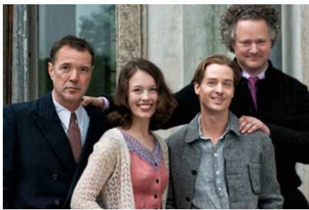
„Werk ohne Autor (AT)“

Mit „Werk ohne Autor (AT)“ von Oscar-Preisträger Florian Henckel von Donnersmarck und „Der Hauptmann“ von Robert Schwentke unterstützte die Mitteldeutsche Medienförderung die neuen Projekte international renommierter deutscher Regisseure. Zudem wird Joseph Bierbichler seinen Erfolgsroman „Mittelreich“ mit Unterstützung der MDM realisieren. Hinzu kommt mit „Bibi & Tina – Tohuwabohu Total“ die Fortsetzung der populären und erfolgreichen Kinoreihe unter der Regie von Detlev Buck.