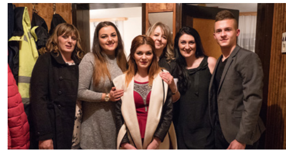
„Hier und dort“