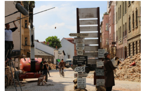
„Es war einmal in Deutschland...“