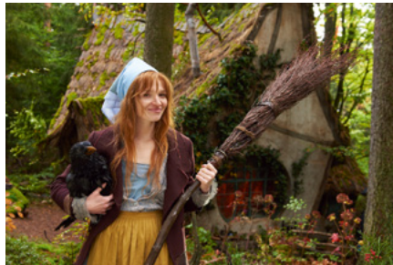
„Die kleine Hexe“

Einen weiteren Förderschwerpunkt der MDM stellen traditionell Kinderfilme dar. Mit „Die kleine Hexe“ und „Pettersson & Findus 3 – Findus zieht um“ wurden zwei Adaptionen bekannter und erfolgreicher Kinderbuchklassiker gefördert. Aber auch die Stärkung originärer Kinderfilmstoffe liegt der MDM am Herzen. So wurde mit der Abenteuergeschichte „Die Unsichtbaren (AT)“ erneut ein Projekt im Rahmen der im Jahr 2013 gestarteten bundesweiten Initiative „Der besondere Kinderfilm“ unterstützt. Darüber hinaus erhielten anspruchsvolle Animationsprojekte MDM-