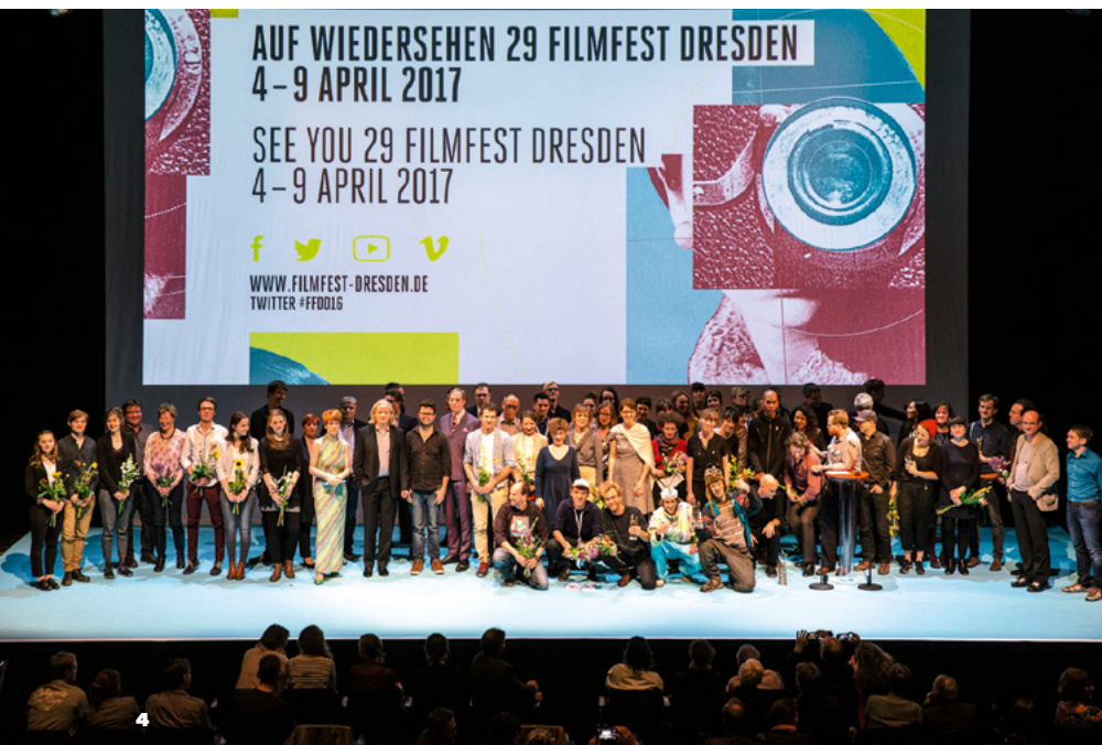
4 28. Filmfest Dresden 2016 5 DOK Leipzig 2016 6 Filmkunsttage 2016: Ministerpräsident Reiner Haseloff mit Filmkunsttage-Preisträgerin Maria Schrader

Jahr des Festivals die Sparte Experimentalfilm hinzu. Bei der Preisverleihung wurden auch drei MDM-geförderte Produktionen prämiert. So erhielt Falk Schuster für „Die Weite suchen“ den Publikumspreis in der Kategorie Animation. Ebenfalls einen Publikumspreis sowie den Jurypreis im Bereich Dokumentarfilm bekamen Yalda Afsah und Ginan Seidl für „Boy“. Zudem erhielt Sarah Schreier eine lobende Erwähnung der Jury für ihren Spielfilm „Fische“. Zahlreiche einheimische Arthouse-Produktionen wurden im Oktober bei den 6. Filmkunsttagen Sachsen-Anhalt präsentiert. In der Reihe „Panorama Mitteldeutschland“ wurden Filme gezeigt, die komplett oder zum Teil in der Region entstanden sind, unter anderem Fatih Akins „Tschick“, „Frantz“ von François Ozon sowie „24 Wochen“ von Anne Zohra Berrached. Höhepunkt der Filmkunsttage war die Verleihung der Filmkunstpreise Sachsen-Anhalt. Über den Ehrenpreis des Ministerpräsidenten aus den Händen von Reiner Haseloff konnte sich Schauspielerinnen und Regisseurin Maria Schrader freuen. Einen umfassenden Einblick in das Filmschaffen der Nachbarländer Deutschland, Polen und Tschechien sowie anderer osteuropäischer Nationen bot das Weißer Filmfestival. In