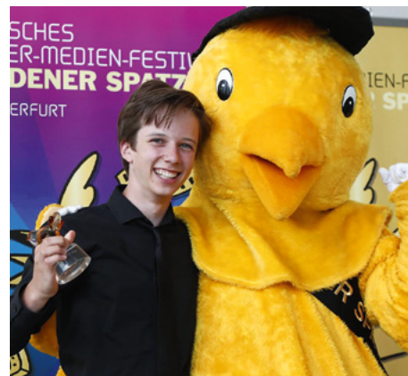
Deutsches Kinder-Medien-Festival GOLDENER SPATZ