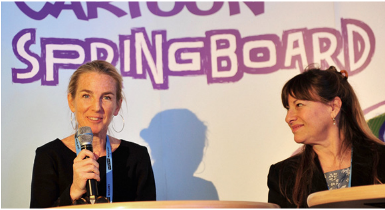
„Cartoon Springboard“ in Halle (Saale)