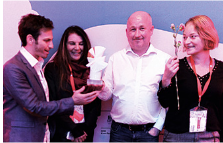
Verleihung der Goldenen Taube an „Muhi – Generally Temporary“ beim 60. DOK Leipzig