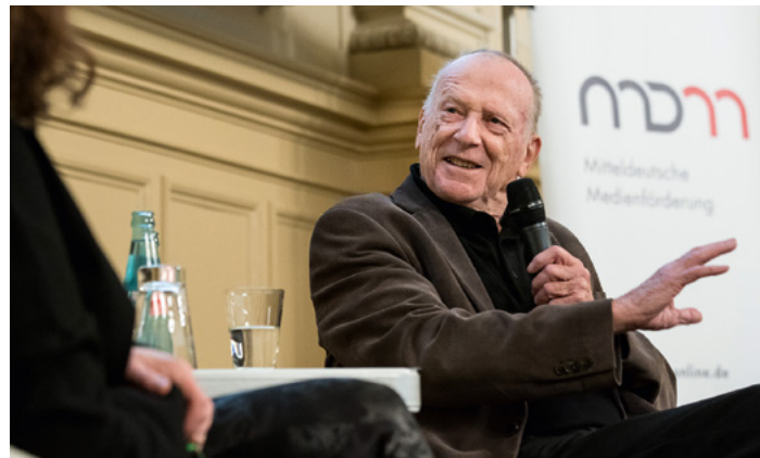
Die Preisträger des Deutschen Filmmusikpreises