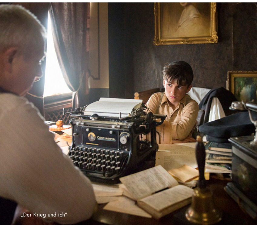
„Der Krieg und ich“

Rund 15 Millionen Euro stellte der Vergabeausschuss der Mitteldeutschen Medienförderung 2017 für die Entwicklung, Produktion und Auswertung von insgesamt 171 Film- und Medienprojekten in der Region zur Verfügung. Knapp 11 Millionen Euro davon wurden für die Produktion von 55 Kino- und Fernsehfilmen vergeben, darunter für die aktuellen Projekte der renommierten Filmemacher Andreas Dresen, Detlev Buck und Peter Kahane. Darüber hinaus förderte das Gremium insgesamt 19 Nachwuchs-Produktionen mit über 1,5 Millionen Euro.