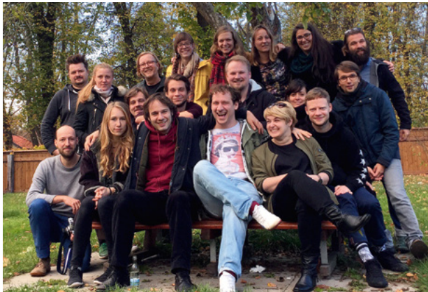
Teilnehmer TP2 Talentpool 2017/2018

Stadt und die Entwicklung der städtischen Gemeinschaft im Mittelpunkt. Erstmals im Rahmen des Werkleitz-Festivals fand das 3. Foresight Filmfestival statt. Hier zeigten Visionäre aus Forschung, Film, Medien und Gesellschaft in Kurzfilmen ihre Visionen für eine gemeinsame Zukunft.