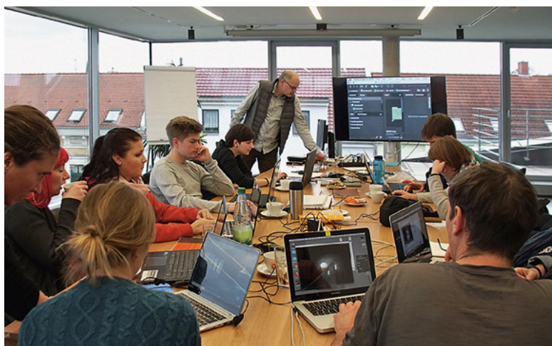
Fortbildung zum Locationscout