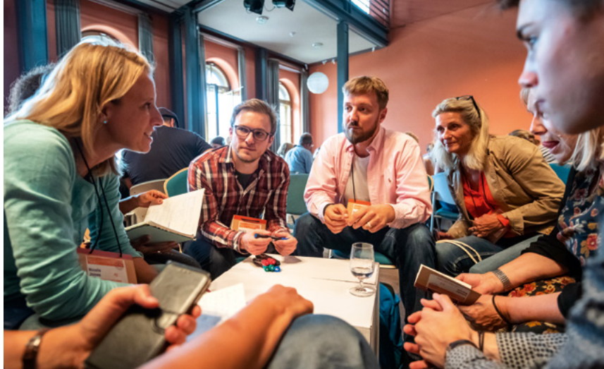
Konferenz „Zukunft Kinderfilm“

Auf der Agenda der 20. Medientage Mitteldeutschland standen Ende April wieder aktuelle medienpolitische Herausforderungen. Bei rund 30 Veranstaltungen diskutierten in der Leipziger Media City namhafte Vertreter aus Medien, Politik,