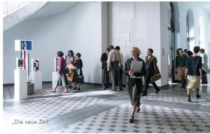
„Die neue Zeit“

Objekt einbauen: die Wohnräume von Marc-Uwe und dem Känguru sowie das luxuriöse Penthouse ihres Widersachers. Fast vollständig in Sachsen-Anhalt realisierte Mark Schlichter die Neuauflage des DDR-Kinderklassikers „Alfons Zitterbacke“. Im Technik- und Luftfahrtmuseumspark Merseburg, der mit seinen stillgelegten Flugzeugen und Hubschraubern eine ideale Kulisse abgab, setzte er den großen Fluggeräte-Wettbewerb am Ende des Films in Szene. Hauptdrehort war jedoch Halle (Saale): Im Stadtteil Dölau fand das Filmteam das geeignete Einfamilienhaus für Familie Zitterbacke, die Schulszene entstanden im Christian-Wolff-Gymnasium in Halle-Neustadt. Ein weiteres Motiv war der Hellweg Bau- und Gartenmarkt in der Merseburger Straße, wo Cast und Crew bei laufendem Betrieb drehten. Auch für serielle Projekte war Halle 2018 gefragt: Die 26 Folgen der Webserie „findher“, in der der 29-jährige Tim sich bei einer Dating-App anmeldet und fortan jede Menge denkwürdige Verabredungen erlebt, entstanden in der alten Schwemme-Brauerei der Stadt. Für „In aller Freundschaft – Die Krankenschwestern“, einen neuen Ableger der erfolgreichen Krankenhaus-Soap, mieteten die Produzenten die nicht mehr genutzten Räumlichkeiten der früheren Orthopädie der Uniklinik in der Magdeburger Straße an. Sie werden in der neuen Serie zum fiktiven Volkmann-Klinikum.