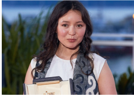
„Ayka“-Darstellerin Samal Yeslyamova