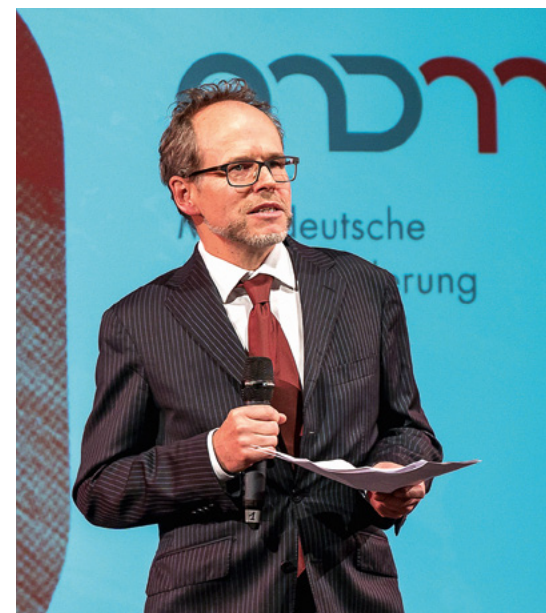
Mit zahlreichen Vertretern der mitteldeutschen und überregionalen Medienwirtschaft feierte die MDM Ende November im Leipziger Kupfersaal ihr 20-jähriges Jubiläum.