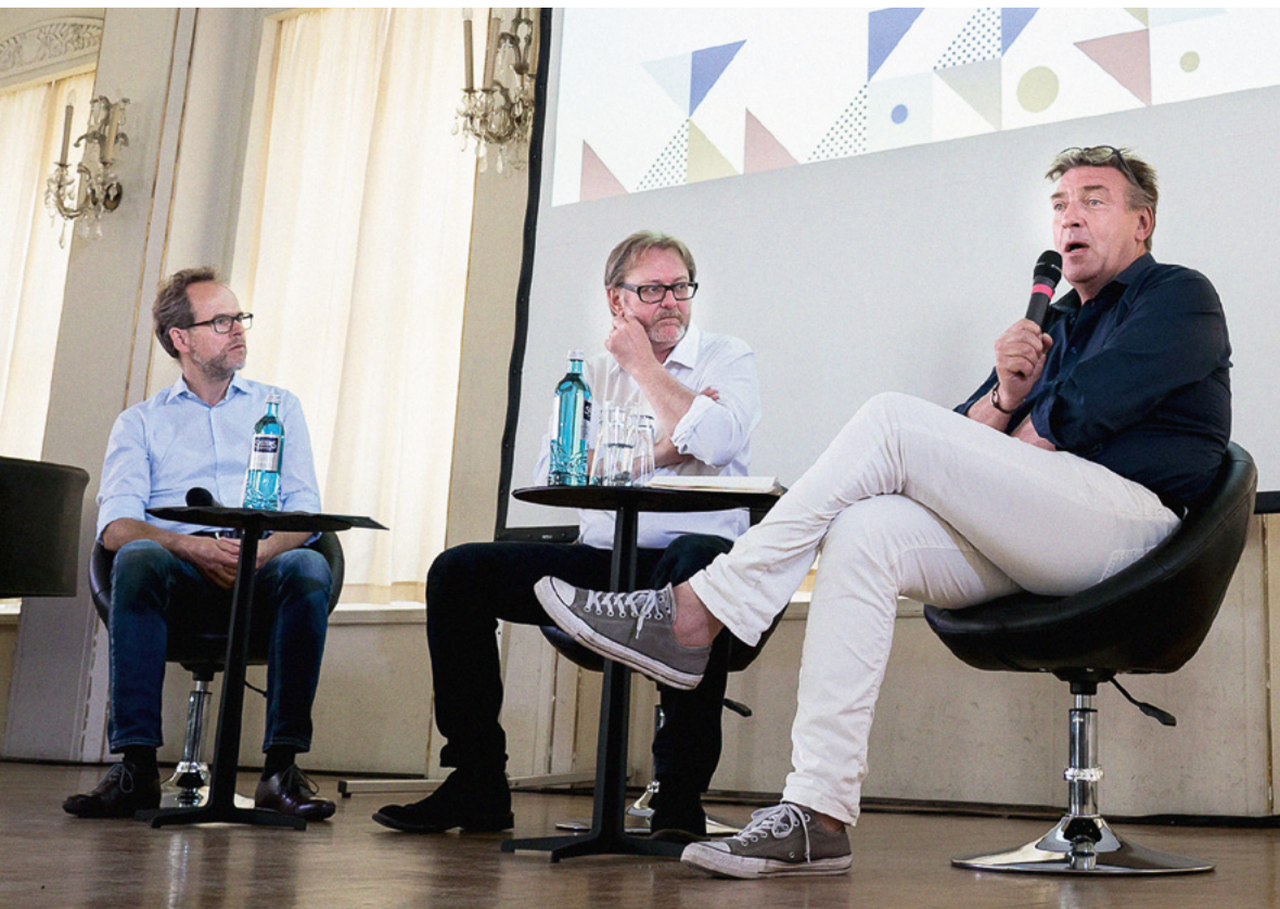
Im Juni wurde mit Gästen aus Dänemark und Schweden zum zweiten Mal die Filmkonferenz „Meet Your Neighbour“ in Leipzig abgehalten