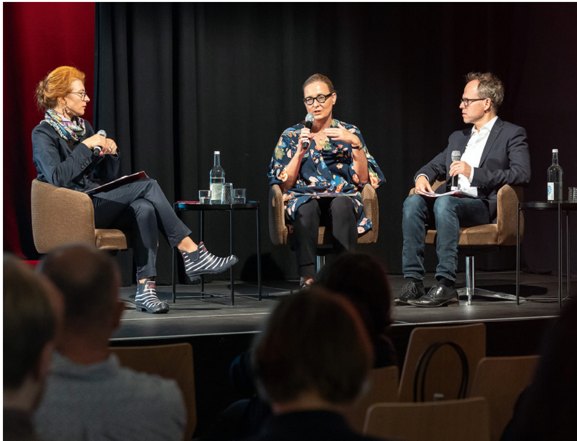
Im September wurde mit Gästen aus Österreich und der Schweiz zum dritten Mal die Filmkonferenz „Meet Your Neighbour“ in Leipzig abgehalten