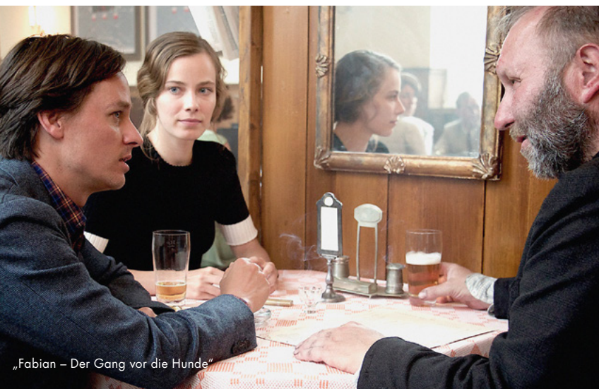
„Fabian – Der Gang vor die Hunde“

Über 16,3 Millionen Euro stellte der Vergabeausschuss der Mitteldeutschen Medienförderung 2019 für die Entwicklung, Produktion und Auswertung von insgesamt 175 Film- und Medienprojekten in der Region zur Verfügung. Über elf Millionen Euro wurden für die Produktion von 53 Kino- und Fernsehfilmen vergeben. Hiervon entfielen fast 3,7 Millionen Euro auf 24 Nachwuchs-Produktionen. Neben rein deutschen Projekten stand auch die Förderung von internationalen Koproduktionen wieder im Fokus.