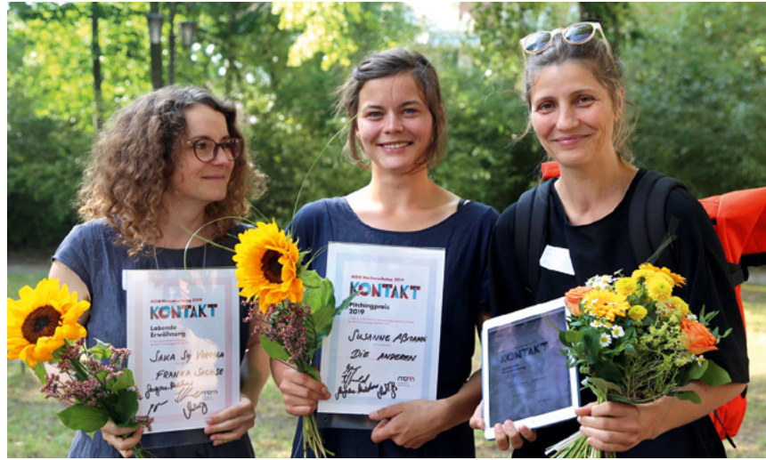
MDM Nachwuchstag KONTAKT

Beim MDM Pilotprogramm erhalten ausgewählte Teilnehmer die Möglichkeit, originelle und mit überschaubarem Aufwand umsetzbare Microbudget-Filme zu realisieren. Intensiv betreut werden sie dabei von erfahrenen Tutoren. Daneben gewährt ihnen das Programm auch finanzielle Unterstützung: Die Fördersumme beträgt für jedes Projekt bis zu 250.000 Euro und wird nicht als Darlehen, sondern als Zuschuss vergeben. Ob dokumentarisch oder fiktional, animiert oder experimentell – Filme aller Gattungen sind zulässig, zudem gelten keine spezifischen Längen- oder Formatvorgaben. Entscheidend sind die Originalität der Stoffe sowie das Potenzial der Filmemacher. Das Pilotprogramm ist in drei Stufen aufgebaut und orientiert sich an den Phasen der Filmherstellung: