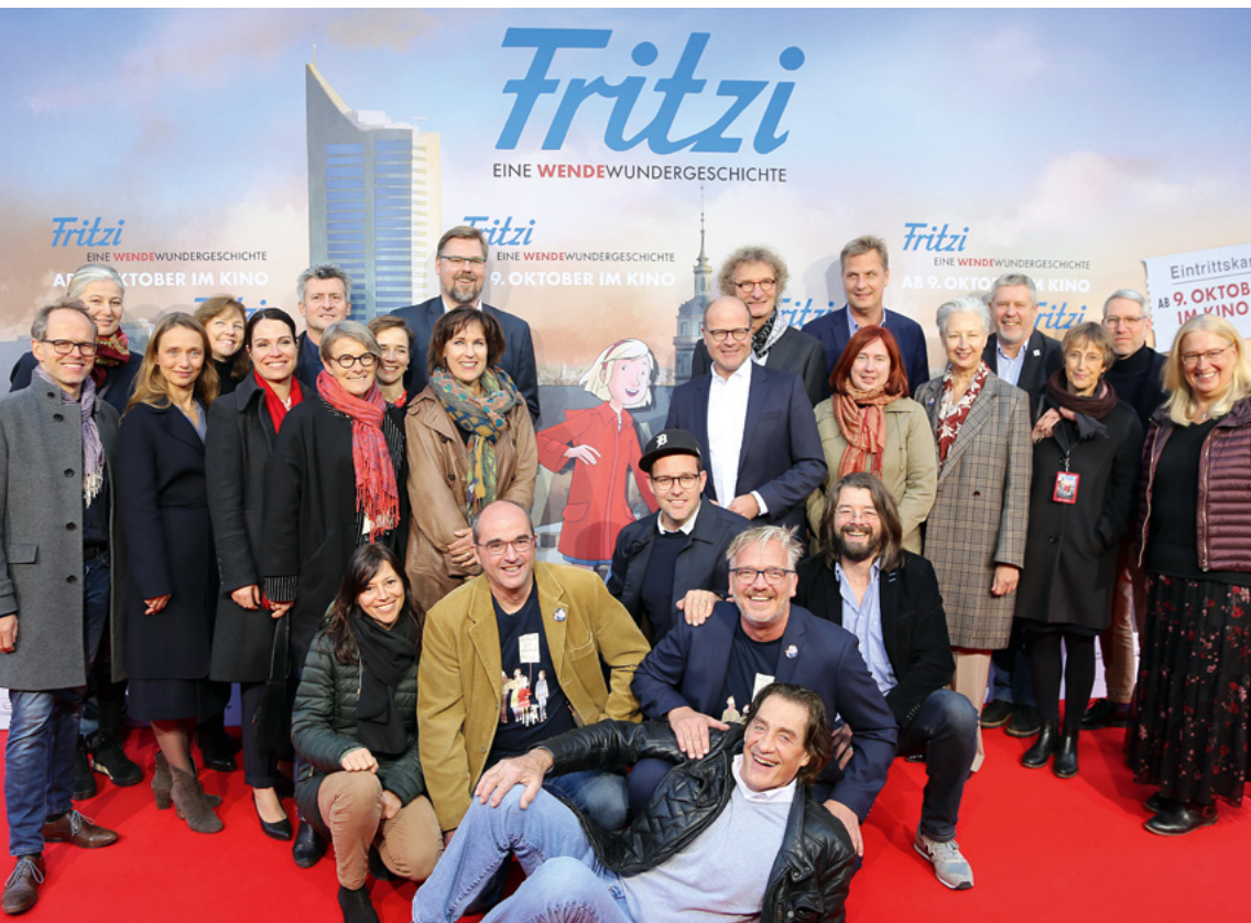
In der Leipziger Nikolaikirche fand Anfang Oktober die feierliche Premiere des Animationsfilms „Fritzi – Eine Wendewundergeschichte“ statt