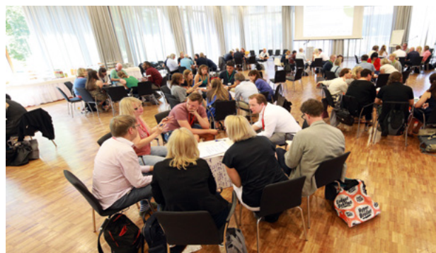
KIDS Regio Forum 2019

Zusammenarbeit zwischen Produzenten und Medienschaffenden in den Mitgliedsländern bei gemeinsamen Projekten zu verbessern, Koproduktionen zu initiieren und Auslandsdreharbeiten mit fachlichem Rat und praktischer Hilfe zu unterstützen. In Kooperation mit Cine-Regio haben die MDM und der Freistaat Thüringen 2008 die Initiative KIDS Regio ins Leben gerufen. Sie widmet sich der Verbesserung von Bedingungen für den europäischen Kinder- und Jugendfilm und entwickelt in regelmäßigen Arbeitstreffen Strategien zu den Themen Finanzierung, Entwicklung und Verwertung.