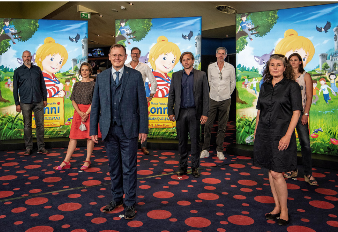
Im CineStar Erfurt fand am 1. Juli eine Vorpremiere des Animationsfilms „Meine Freundin Conni – Geheimnis um Kater Mau“ statt. Gekommen war auch Thüringens Ministerpräsident Bodo Ramelow (3.v.l.).