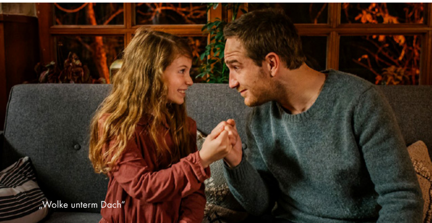
„Wolke unterm Dach“

Über 15,2 Millionen Euro stellte der Vergabeausschuss der Mitteldeutschen Medienförderung 2020 für die Entwicklung, Produktion und Auswertung von insgesamt 146 Film- und Medienprojekten in der Region zur Verfügung. Über zwölf Millionen Euro wurden für die Produktion von 59 Kino- und Fernsehstoffen vergeben. Hiervon entfielen fast 3,3 Millionen Euro auf 25 Nachwuchs-Produktionen. Neben rein deutschen Projekten stand auch die Förderung von internationalen Koproduktionen wieder im Fokus.