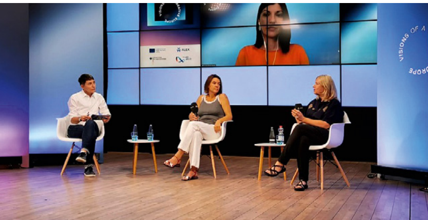
Konferenz „Visions of a Creative Europe“