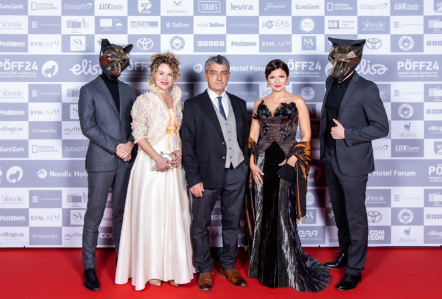
Weltpremiere „Der Hochzeits- schneider von Athen“ in Tallinn