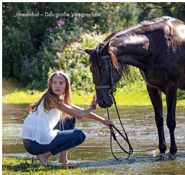
„Immenhof – Das große Versprechen“