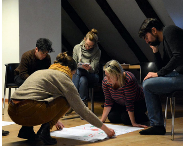
Akademie für Kindermedien

Um dem personellen und fachlichen Bedarf vieler Produktionen in Corona-Zeiten Rechnung zu tragen, veranstaltete die MDM Film Commission zusammen mit der DEKRA im September eine eintägige Online-Schulung zum „Hygienebeauftragten für Film-, Fernseh- und Fotoproduktionen“ . Nach einer Einführung in die rechtlichen Grundlagen vermittelte das Web-Seminar praxisnahes Wissen zu Erregerarten (mit Schwerpunkt