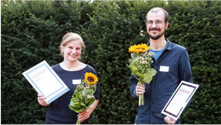
MDM Nachwuchstag KONTAKT

Im Sommer 2019 riefen MDM und ZDF/Das kleine Fernsehspiel das Förderprogramm „Fifty-Fifty“ ins Leben. 2020 wurden mit den Dokumentarfilmen „Chefs“ von Wolfram Huke (Produzent: Hoferichter & Jacobs) und „David“ von Antje Schneider (Produzent: Kloos & Co.) die ersten beiden Projekte gefördert. „Fifty-Fifty“ soll der Stärkung des Filmnachwuchses in Sachsen, Sachsen-Anhalt und Thüringen dienen und ist zunächst auf einen Zeitraum von vier Jahren angelegt. Die Gesamtfinanzierung zur Förderung von Nachwuchsprojekten beträgt bis zu einer Million Euro pro Jahr, paritätisch getragen von MDM und ZDF. Die Anzahl der geförderten Produktionen ist dabei flexibel. Unterstützt werden TV-Produktionen zeitgenössischer Stoffe und vielfältiger Genres: Spiel-, Dokumentar- und Animationsfilme sowie Hybridformen und Miniserien mit Gesamtlängen von 40 bis 120 Minuten. Die Herstellung sollen mitteldeutsche Produktionsfirmen übernehmen, unter Einbeziehung von möglichst dort wohnhaften Nachwuchstalenten aus den Bereichen Drehbuch und Regie.