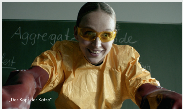
„Der Kopf der Katze“

Dokumentarfilm Antragsteller: Kloos & Co. Ost UG; Buch/Regie: Antje Schneider Fördersumme: 120.000,00 €