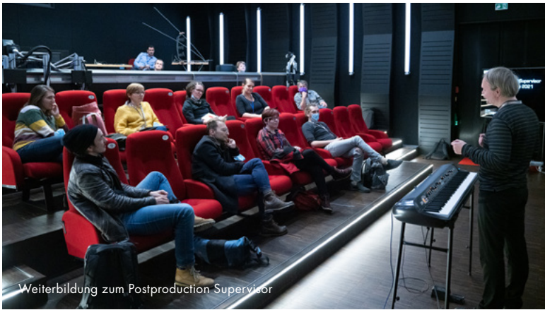
Weiterbildung zum Postproduction Supervisor