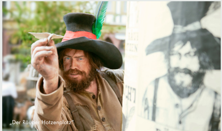
„Der Räuber Hotzenplotz“

Animationsserie Antragsteller: Balance Film GmbH; Buch: Beate Völcker; Regie: Ralf Kukula, Matthias Bruhn, Thomas Meyer-Hermann Fördersumme: 530.000,00 €