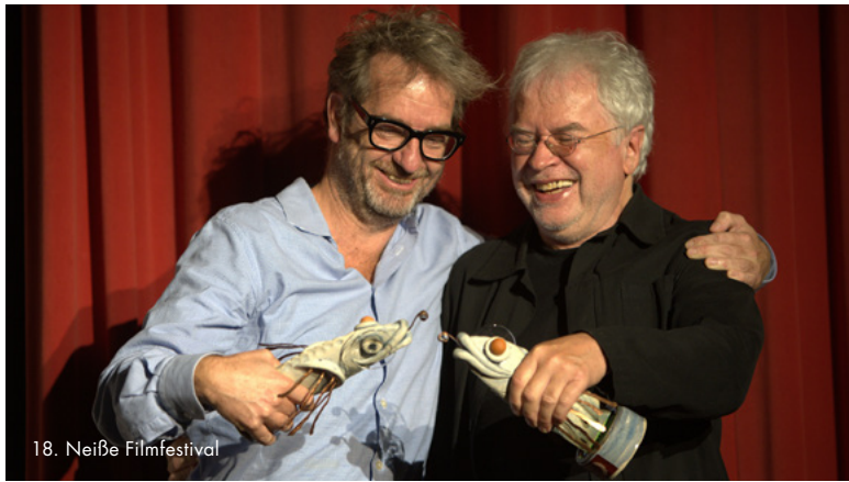
18. Neißer Filmfestival

Das 18. Neißer Filmfestival im Dreiländereck Deutschland-Polen-Tschechien bot Mitte September an mehr als 20 Spielorten Einblicke in das Filmschaffen der drei Nachbarländer sowie anderer osteuropäischer Nationen. Wegen der Corona-Pandemie wurde das Festival wie 2020 von sechs auf vier Tage verkürzt. Trotzdem erwarteten die Anwesenden über 60 Spiel-, Dokumentar- und Kurzfilme sowie ein gewohnt vielseitiges Rahmenprogramm mit Ausstellungen, Lesungen, Filmgesprächen und Konzerten. Im Spielfilmwettbewerb des Festivals um den besten Spielfilm konkurrierten neun Produktionen um den mit 10.000 Euro dotierten „Drei-Länder-Filmpreis“ der sächsischen Kunstinisterin. Mit „Der Masseur“ von Malgorzata Szumowska und Michał Englert sowie „Grenzland“ von Andreas Voigt gehörten auch zwei von der MDM unterstützte Werke zum diesjährigen Programm. „Grenzland“ gewann den Spezialpreis des Filmverbands Sachsen.