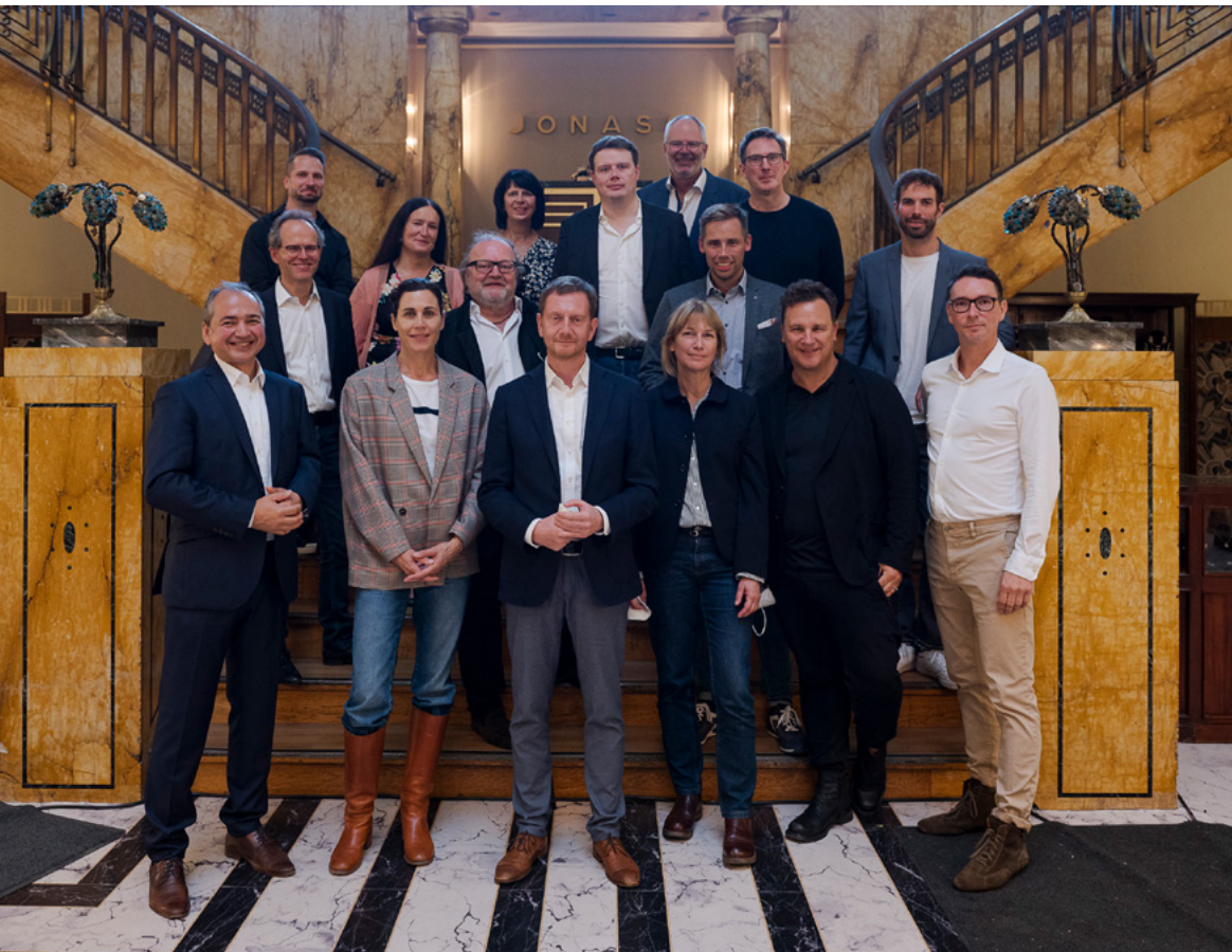
Im September besuchte Sachsens Ministerpräsident Michael Kretschmer die Dreharbeiten zur historischen High-End-Serie „Torstraße 1“ in Görlitz