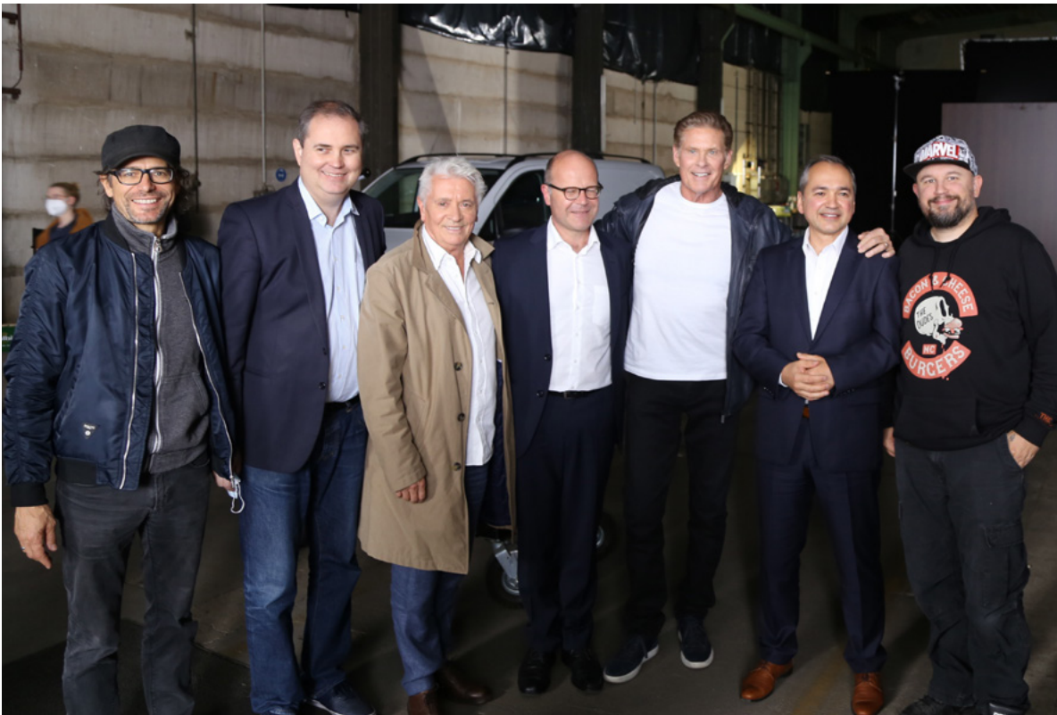
Ebenfalls in Görlitz entstanden Teile der schräg-humorvollen High-End-Serie „Ze Network“ mit David Hasselhoff und Henry Hübchen