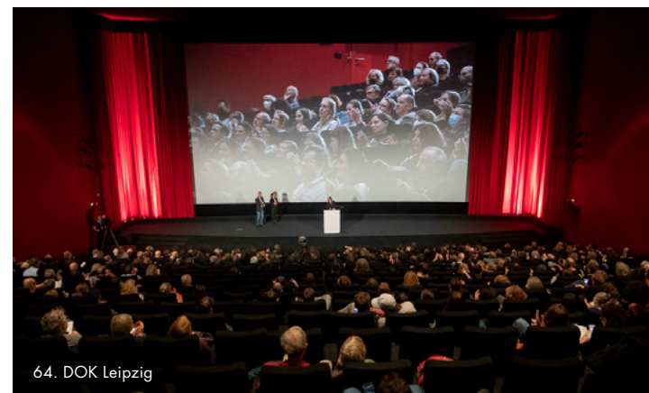
64. DOK Leipzig